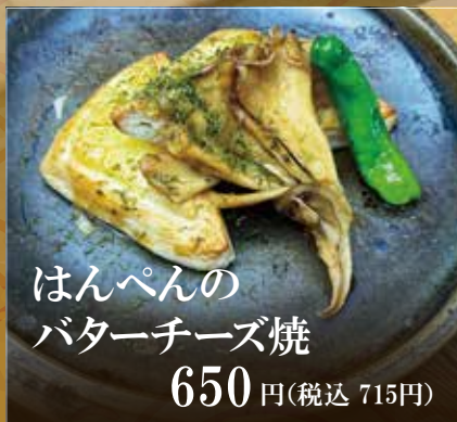
はんぺんの バターチーズ焼