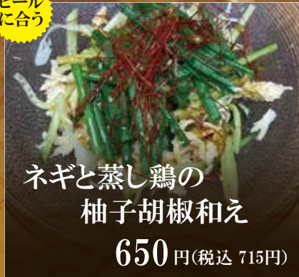
ネギと蒸し鶏の 柚子胡椒和え