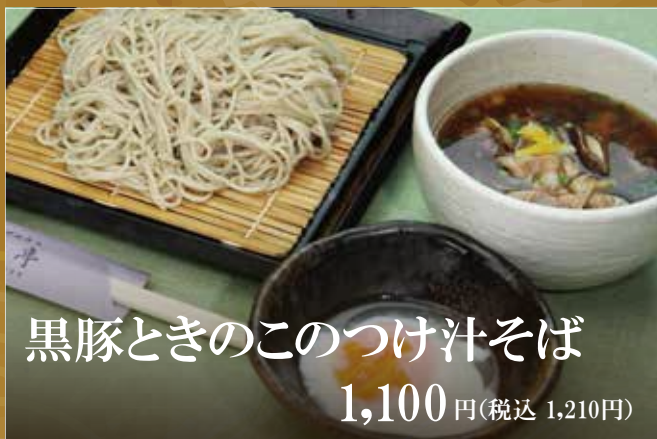
黒豚ときのこのつけ汁そば