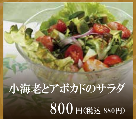
小海老とアボカドのサラダ