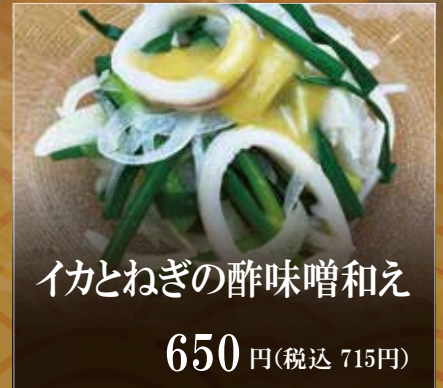
イカとねぎの酢味噌和え