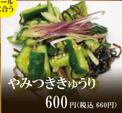
やみつききゅうり