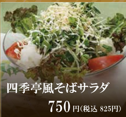
四季亭風そばサラダ