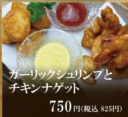
ガーリックシュリンプと チキンナゲット

定番のものから趣向を凝らした揚げ物まで、口にした瞬間にあふれるアツアツで香ばしい歯ごたえをご堪能ください。