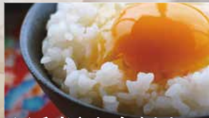
四季亭卵かけごはん (青唐辛子醤油漬け付き)

お酒のあとは、お食事メニューでお腹も気持ちも満腹にしてみませんか？ 当店のお食事メニューもバラエティー豊富に取り揃えております。