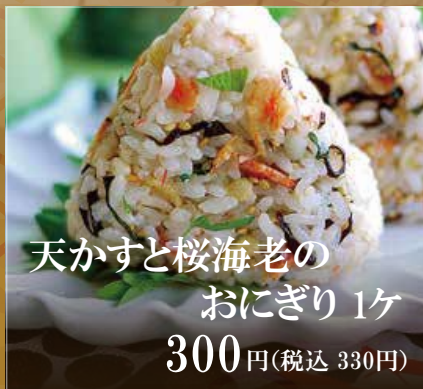
天かすと桜海老の おにぎり 1ヶ