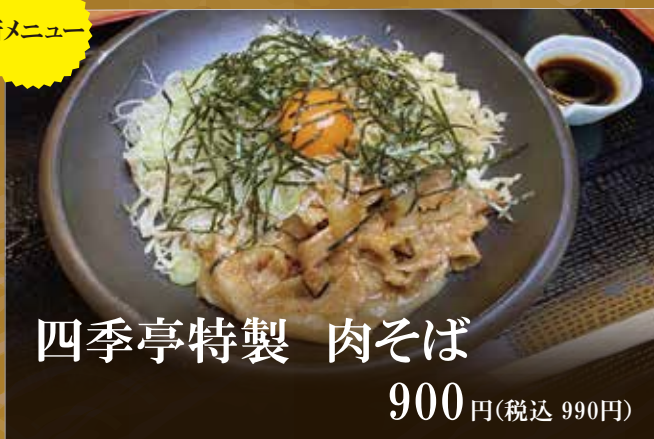
四季亭特製 肉そば