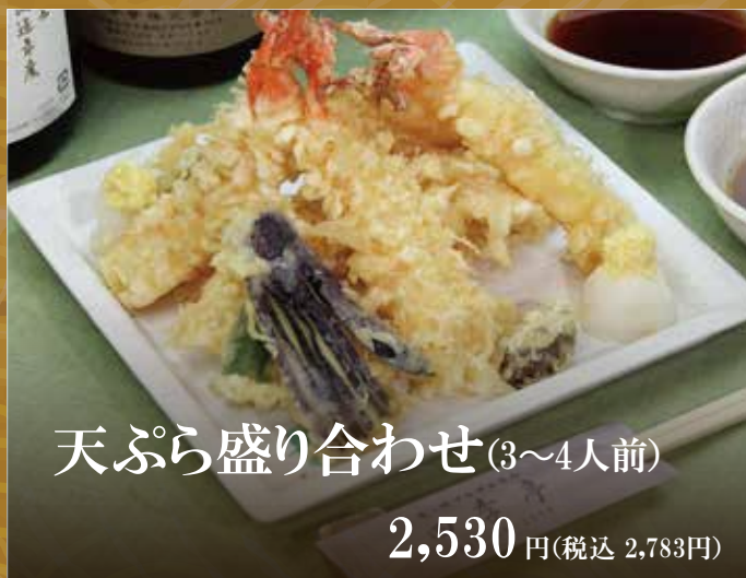
天ぷら盛り合わせ(3~4人前)