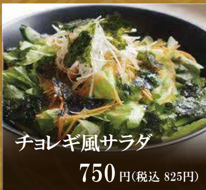
チヨレギ風サラダ